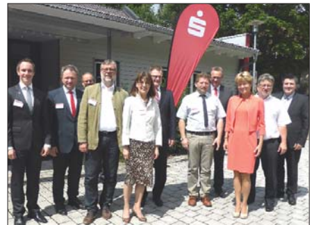
Repräsentanten aus Finanzwirtschaft und Kommunalpolitik beim Fototermin.

Für den Bezahlvorgang im Online-Shop benötigt der Käufer nur Benutzernamen und Passwort. Sowohl Online-Händler als auch Kommunen haben viele Vorteile: Geringere Kosten im Vergleich zu PayPal, eine hohe Reichweite, da alle deutschen Girokontoinhaber, die einen Online-Banking-Zugang haben, sicher und einfach mit paydirekt bezahlen können. □