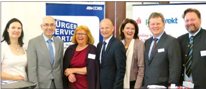
Im Rahmen des Bayerischen Landkreistags in Bad Kissingen informierte die S-Finanzgruppe als Zahlungsverkehrs-Partner der AKDB unter anderem über ihr Angebot „paydirekt“ (vgl. Seite 6, Kommunalforum Sparkasse Mittelfranken). Dabei handelt es sich um eine zuverlässige Bezahlpattform, die auf die Anforderungen der öffentlichen Verwaltung ausgerichtet ist und sich über offene Schnittstellen in Fachverfahren und Portale einbinden lässt. Ein sicherer Betrieb im AKDB-Rechenzentrum sowie attraktive Konditionen und eine einfache Abwicklung durch einen Rahmenvertrag mit dem Payment-Service-Provider sind garantiert.

Eine Rückübertragung von Kompetenzen an die Mitgliedsländer hält der Großteil der Befragten – 48 Prozent – für die bessere Alternative, damit die EU wieder mehr Akzeptanz bei den Bürgern findet. Nur 27 Prozent sehen in einer Kompetenzverlagerung an die EU die Lösung des Akzeptanzproblems.