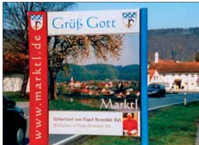
Die Verbundenheit mit dem bayerischen Papst Benedikt XVI. wird im Freistaat intensiv gepflegt. Zahlreiche Orte bieten ihren Besuchern ein vielfältiges „Papst-Programm“. Rechtzeitig zum runden Geburtstag des Heiligen Vaters hat Markt am Inn, sein Geburtsort, neue Ortsschilder erhalten. Am 16. April 1927 wurde hier Josef Ratzinger geboren.