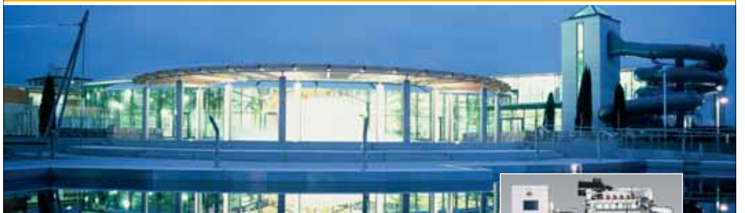
Ergomar Erlebnisbad in Ergolding – für Wärme und Strom sorgt ein Blockheizkraftwerk