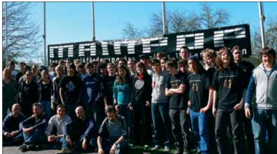
Den Termin für das MainPop-BandCamp des Bezirks Unterfranken halten sich alle, die schon Gelegenheit hatten daran teilzunehmen, unbedingt frei. Auch in diesem Jahr war es wieder ein voller Erfolg.