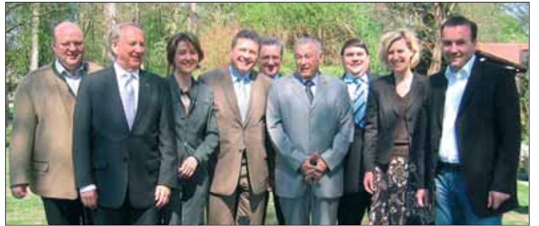
Zur Klausurtagung traf sich die CSU-Europagruppe am Wochenende in Bad Gögging. Unter anderem wurden dabei auch Fragen der inneren Sicherheit mit dem bayerischen Innenminister Dr. Günther Beckstein diskutiert.

Der ständige und konstruktive Austausch mit den Kommunalpolitikern sei für die Arbeit der CSU-Fraktion zentral, so CSU-