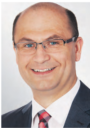
Finanzminister Albert Füracker.

Füracker: „Unsere Breitband-Strategie ist genau richtig für Bayern. Mit dem aktuellen Förderprogramm bringen wir die Glasfaser in die Gemeinden und