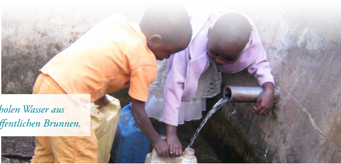
Kinder holen Wasser aus einem öffentlichen Brunnen.

Auch beim Kraftwerksdesign, sprich der Netzanbindung, bei Betrieb, Wartung und Support sowie beim Automatisierungsgrad des Kraftwerks, galt es Herausforderungen zu bewältigen. Die Schaltschrankplanung erfolgte durch F.EE in 3D. Das Unternehmen verfügt über ein 8.500 m 2 großes Schaltschrankfertigungszentrum, in dem jährlich ca. 4.000 laufende Meter Schaltschränke unter Einsatz hochwertiger Industriekomponenten montiert, verdrahtet und geprüft werden. Der Vorteil: Ersatzteile sind bis zu 25 Jahre verfügbar.