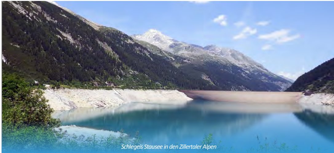
Schlegeis Stausee in den Zillertaler Alpen