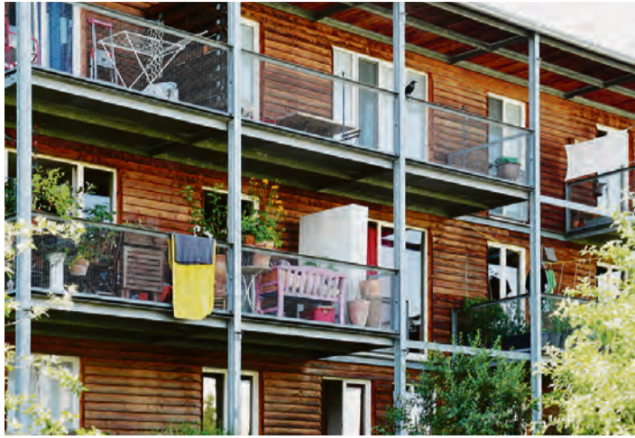
Wohngebäude der Genossenschaft Wogeno im Münchener Stadtteil Messestadt.

„Die neue Kindertagesstätte ist ein vollwertiges Gebäude mit allen Funktionalitäten, die den Kindern eine tolle Atmosphäre bietet und sich gut in die Natur einfügt“, freute sich Oberbürgermeister Christian Schuchardt bei der Einweihung. Träger sind die Johanniter, die Stadt Würzburg hat insgesamt etwa 1 Million Euro in das „Kinderland“ investiert. □