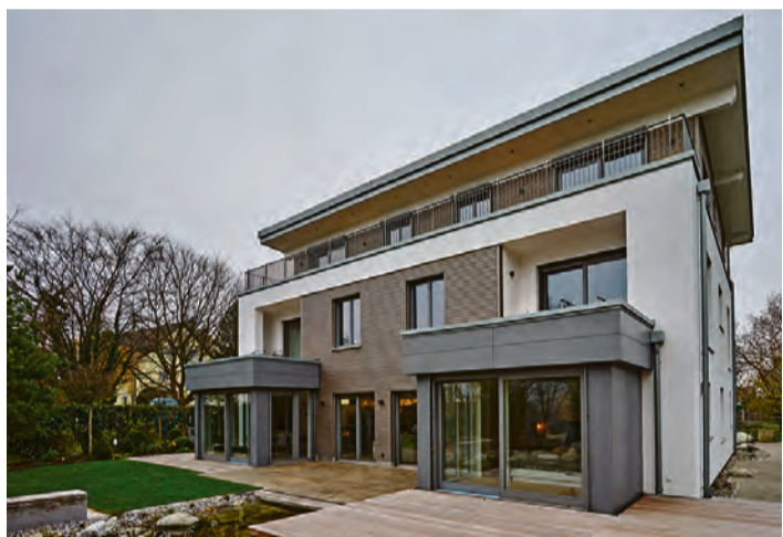
Die Gütesicherung im Holzbau betrifft neben Ein- und Zweifamilienhäusern auch den mehrgeschossigen Holzbau.