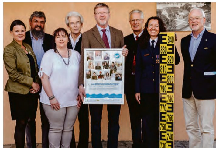
Offiziell gestartet wurde die Kampagne von Umweltminister Dr. Marcel Huber (Mitte) im Beisein von Hochwasserschützern.

In seinem Landkreis wird deshalb viel in den Hochwasserschutz investiert. „Der Freistaat hat mit Unterstützung des Bundes immense Finanzmittel in seinem Haushalt zur Verfügung gestellt. Darum geht es zügig voran.“