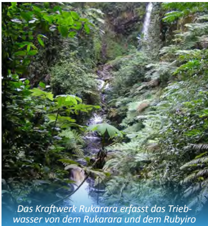
Das Kraftwerk Rukarara erfasst das Triebwasser von dem Rukarara und dem Rubyiro

Rund 20 Prozent der Weltbevölkerung hat laut dem Bundesministerium für wirtschaftliche Zusammenarbeit und Entwicklung keinen Zugang zu Elektrizität. Es sind oft Menschen, die in entlegenen Gebieten wohnen – in Bergen und Tälern, die meisten von ihnen in Afrika. Sie sind abgeschnitten von den öffentlichen, großen Stromnetzen. Eine Netzinfrastruktur in dünn besiedelten Gegenden aufzubauen, ist aufwändig und teuer.