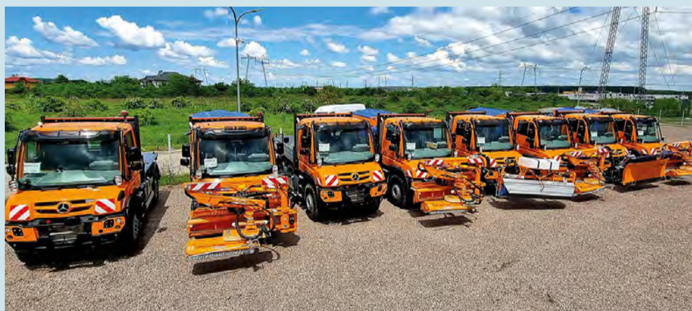
Die rumänische nationale Straßenbauverwaltung CNAIR hat 135 Unimog bestellt.

Wilhelm Mayer GmbH & Co. KG Nutzfahrzeuge, Industriestraße 29-33, 89231 Neu-Ulm, Tel.: 0731 97 56-214, Fax: 0731 97 56-410, E-Mail: nutzfahrzeuge@wilhelm-mayer.com , Internet: www.wilhelm-mayer.com