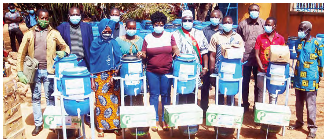
Übergabe der Hygieneprodukte in Gaoua.

Nach der Auftaktveranstaltung im Oktober in Gaoua, bei der das Projekt lokalen Vertretern aus Politik und Zivilgesellschaft vorgestellt wurde, begann