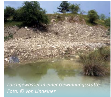
Laichgewässer in einer Gewinnungsstätte

ten und andere vom Aussterben bedrohte Amphibien.