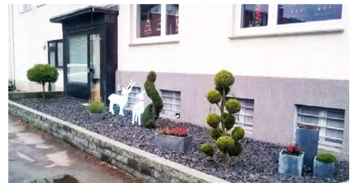
Steinwüsten: Schwarze Steinschüttung im Vorgarten – Was im Winter düster und tristlos wirkt, heizt sich im Sommer extrem auf.

Ein Blick in die freie Natur genügt, um den Denkfehler zu erkennen: In Mitteleuropa sind Schotter- oder Kiesflächen ohne Bewuchs extrem selten zu fin-