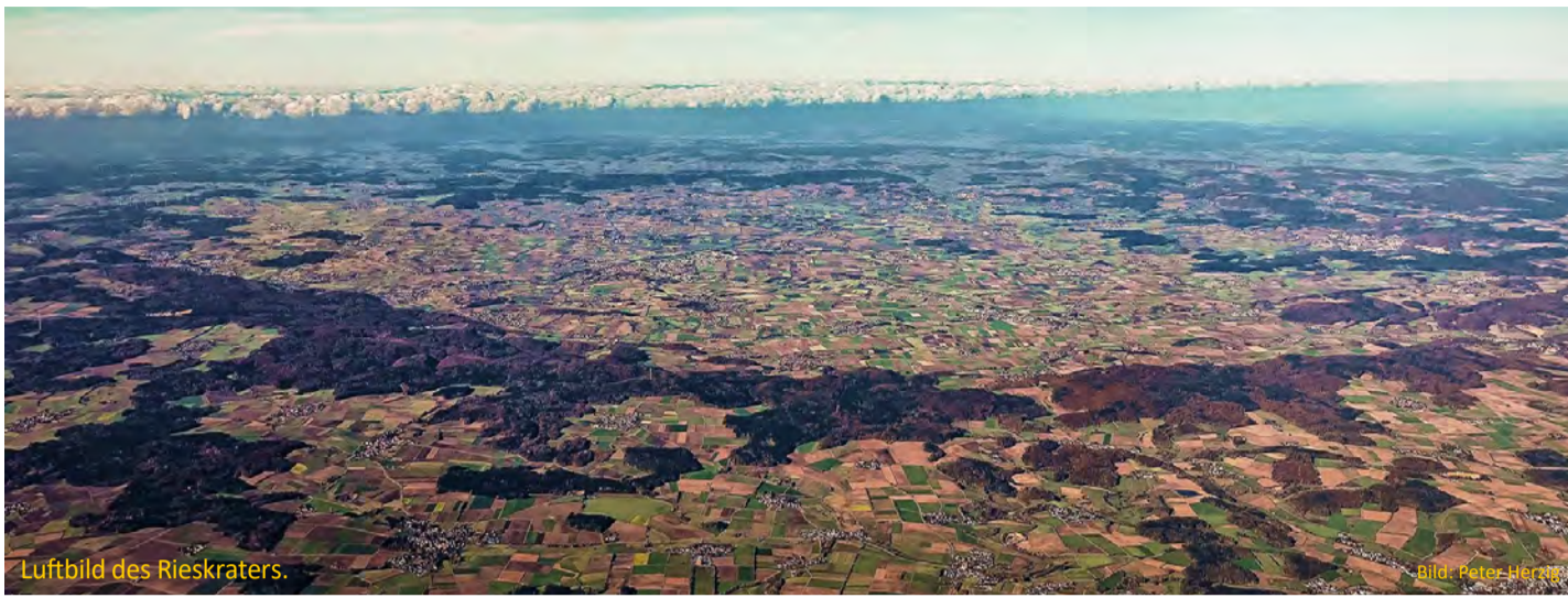
Luftbild des Rieskraters.