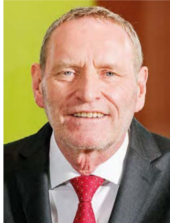
Helmut Schleweis.

Ein Ende der ultraexpansiven Geldpolitik wäre nach Meinung