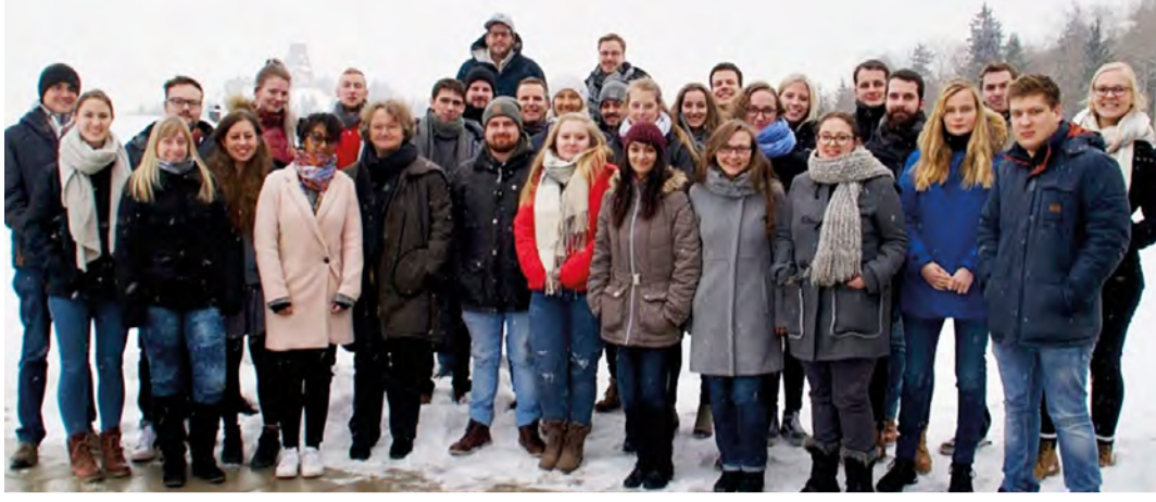
Studierende der Uni Regensburg.