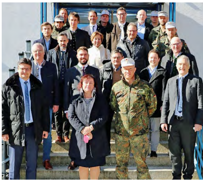
Zahlreiche Vertreter der regionalen Politik hatten sich im Offizierheim des Standortes Bad Reichenhall eingefunden.

Inhaber- und Beteiligungsverhältnisse: 100 % Verlag Bayer. Kommunalpresse GmbH; Geschäftsführerinnen: Constanze von Hassel Theresa von Hassel Anne-Marie von Hassel Druck und Auslieferung: DZO Druckzentrum Oberfranken GmbH & Co. KG Gutenbergstr. 1, 96050 Bamberg Für die Herstellung dieser Zeitung wird Recycling-Papier verwendet.