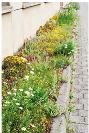
Ein artenreicher, pflegeleichter Saumstreifen am Gebäude bietet Lebensraum und Blütenpracht zugleich.

Was Fachleute bis vor wenigen Jahren noch als Witz äußerten – „Na, dann betoniert euren Garten am besten zu.“ – heute ist es traurige Wirklichkeit. Während sich ein wachsender Teil der Bevölkerung zu Recht Gedanken um den Verlust des Artenreichtums in unserer Umwelt macht, ist ein spezielles Segment begeisterter Hausleubauer munter dabei, auch noch den letzten Zipfel ihres teuer erworbenen Grundstücks hermetisch zu versiegeln. Doch warum das?