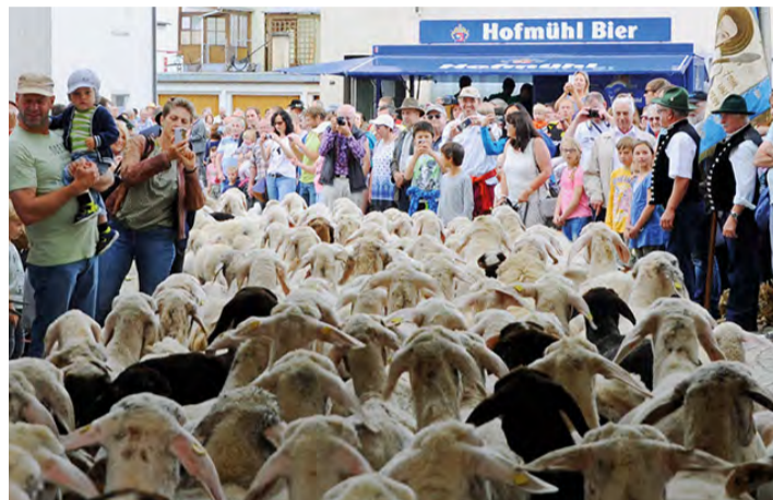
Viele hundert Schafe, Lämmer und Ziegen zwängen sich durch das historische Markttor.

Die Vereine und Wirte der Gemeinde verköstigen die Besucher – natürlich mit „Altmühltaler Lamm“. Kinderaktionen, eine Ausstellung zum Thema „Altmühltaler Lamm“ und vieles