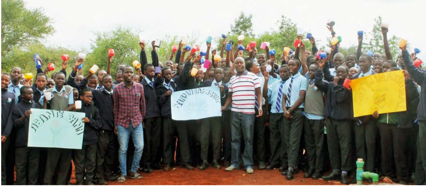
Schüler der Sekundarschule auf dem Schulgelände.