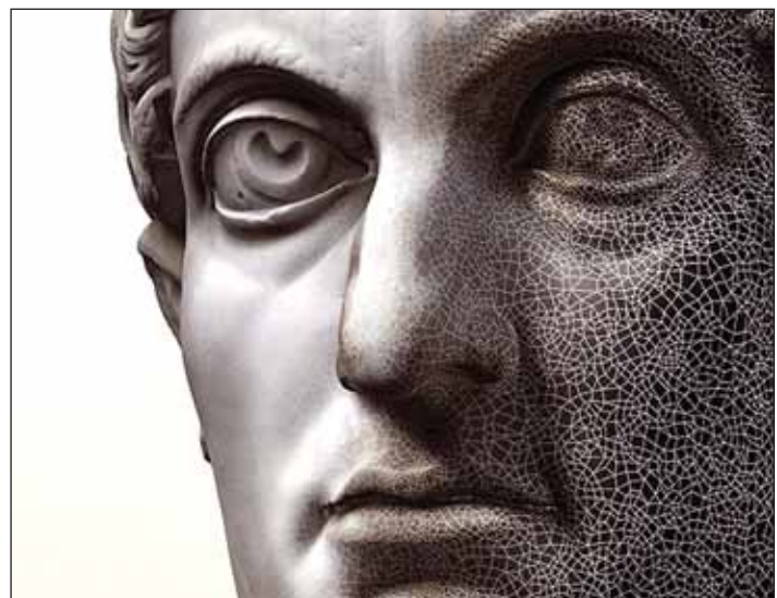
3D-Modell einer Marmorbüste des römischen Kaisers Konstantin.

Derzeit arbeitet die Firma an Felsmotiven im norditalienischen Valcamonica-Tal, die seit 1979 zum UNESCO-Welterbe zählen. Weitere Informationen unter: www.arctron.de/de obx