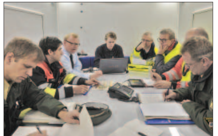
Gemeinsame Lagebesprechung. □

Der neue Leitfaden wird auf der Weltleitmesse für den Brand- und Katastrophenschutz, Rettung und Sicherheit „Interschutz 2015“ vom 8. bis 13. Juni in Hannover auf dem gemeinsamen Stand von AGBF Bund und vfd e.V. (Halle 13, Stand C 38) auf der Themeninsel Vorbeugen- und Brand- und Gefahrenschutz vorgestellt und anschließend zum kostenlosen Download auf der Internetseite der Berufsfeuer-