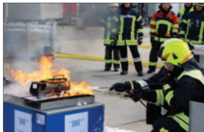
Realistische Übung im Kleinen mit dem Schaumtrainer. □