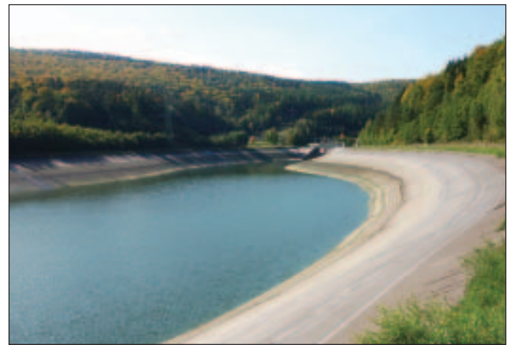
Das Unterbecken wird komplett geleert und neu ausgekleidet. □

Bevor es soweit ist, werden die Fische aus dem Unterbecken von Berufsfischern fachgerecht abgefischt. Entsprechende Vorbereitungen für ein artgerechtes Vorgehen laufen bereits seit November letzten Jahres in Zusammenarbeit mit dem dortigen Fischereiberechtigten. □