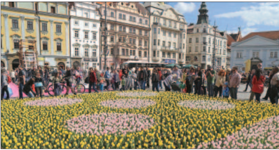
Tausende Blumen waren beim Kunst-, Kultur- und Begegnungsfest „Blumen für Pilsen“ am Hauptplatz zu sehen. □