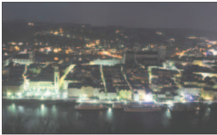
In Passau wurde für eine Stunde die Beleuchtung des Stephandoms, der Wallfahrtskirche Maria Hilf, des Oberhauses und des Rathauses abgeschaltet. □

DALI ist ein Protokoll in der Gebäudeautomatisierung zur Steuerung lichttechnischer Betriebsgeräte, das etwa bidirektionale Kommunikation und stufenloses Dimmen, Statusabfragen der