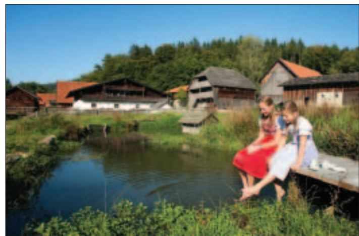
Museumsdorf Bayerischer Wald.

Besucher in Kaufbeuren erhielten freien Eintritt in das Stadtmuseum. Zudem lud das Museum dazu ein, die aktuelle Sonderausstellung „Daniel Hopper. Erfinder der Radierung“ zu besuchen. Begleitend zur Ausstellung wurden zwei Workshops veranstaltet. Vormittags fand eine Druckwerkstatt für Kinder statt. Auf spielerische Weise lernten die Kinder zunächst Daniel Hopper und seine