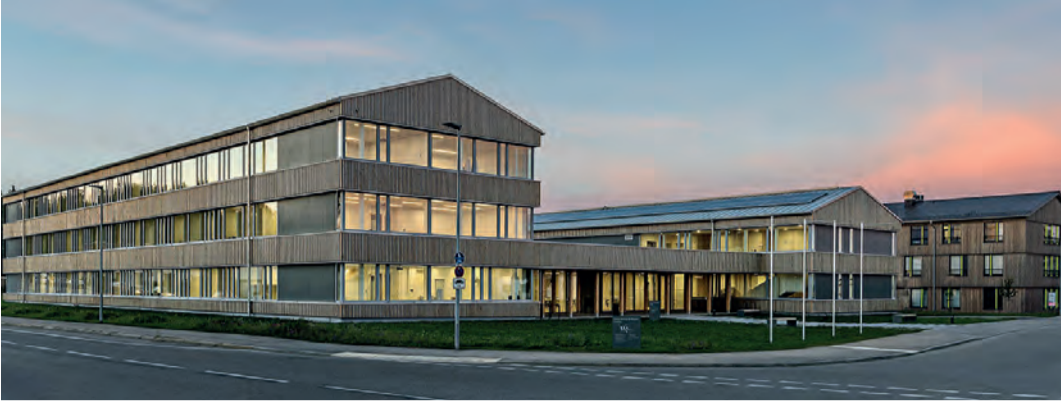
Grünes Zentrum Kaufbeuren: