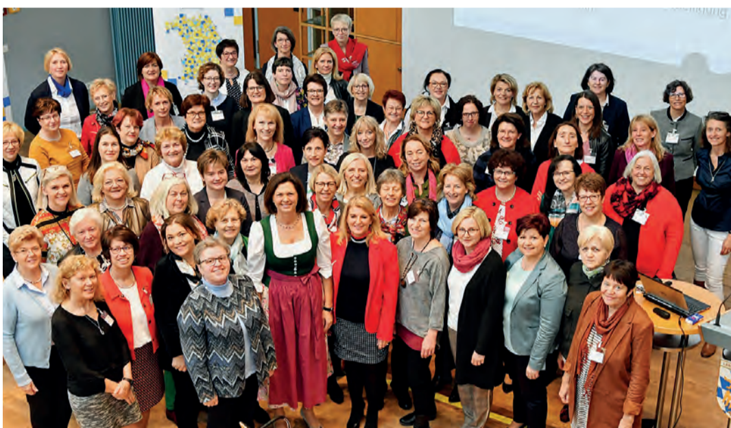
Landtagspräsidentin Ilse Aigner gemeinsam mit Bayerns Bürgermeisterinnen.