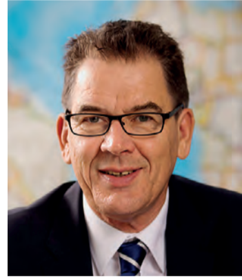
Bundesminister Dr. Gerd Müller.

beit und Umwelterstörungen sind in den vielen illegalen Minen im Kongo an der Tagesordnung. Für unsere T-Shirts werden in Textilfabriken oft Hungerlöhne von 15 Cent pro Stunde bezahlt. In unserer Schokolade oder der Tasse Kaffee steckt noch immer Kinderarbeit. Leider keine Ausnahme: Über 70 Millionen Kinder arbeiten unter ausbeuterischen, gefährlichen Bedingungen.“