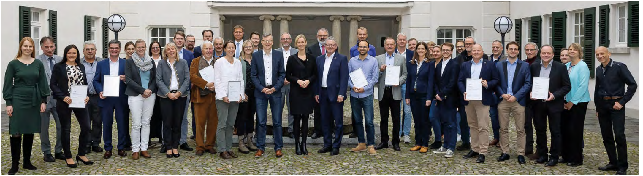
Die Gewinnerinnen und Gewinner des Wettbewerbs „Gemeinsam aktiv. Mobil in ländlichen Räumen“