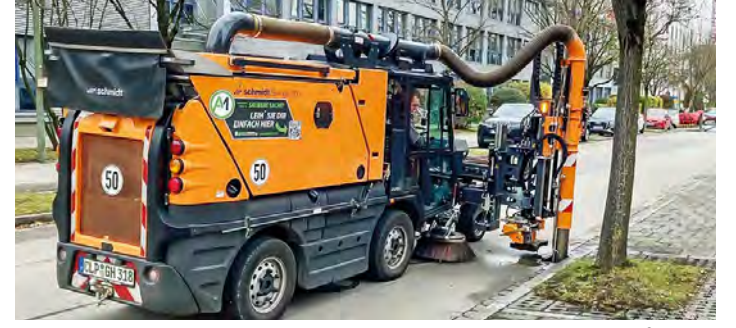
Die Swingo mit Sinkkastenreiniger wird der Gemeinde Unterföhring vorgeführt. Der Kommunaltechnik-Profi Henne Nutzfahrzeuge präsentiert den Bauhof-Kollegen eine leistungsstarke Lösung.

Mit einem Fördervolumen von rund 95 Millionen Euro allein im vergangenen letzten Jahr investiert der Freistaat so viel Geld in die Zukunft der Wälder, wie kein anderes Bundesland. DK